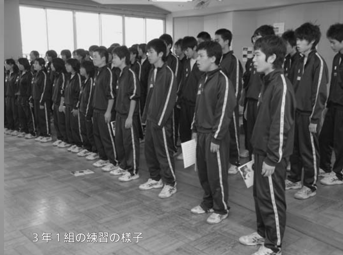
3年1組の練習の様子