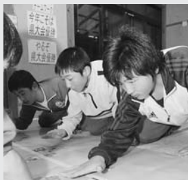
猛特訓ラストサポート!!