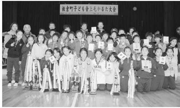
町かるた大会で全部門優勝を果たした若あゆ子ども会