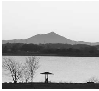
四季折々の渡瀬遊水地の写真を数十点展示

わたらせ自然館 写真展 遊水地の詩 期日 2月3日(日)・17日(日) 時間 午前9時~午後4時30分 出展 オリエンタルカメラクラブ 木工芸展示会 期日 2月23日(土)・3月2日(日) 時間 午前9時~午後4時30分 (初日は午後1時から、最終日は午後4時まで) 写真(二人展) 「バクテン(ラオス)の誘い」 期日 3月5日(水)・16日(日) 時間 午前9時~午後4時30分 内容 については、わたらせ自然館へお問い合わせください。