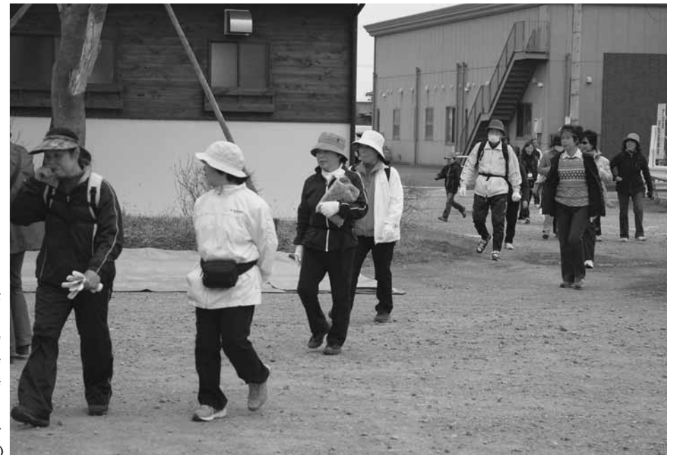
町民体育祭 渡良瀬遊水地ふれあい トライアスロン大会 サッカー大会 少年野球大会 さくらウォーク 町民スポーツフェスティバル (ニチレクボール)