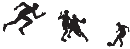
スポーツ大会予定表(10月~3月) 表1