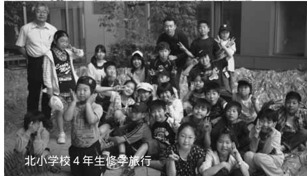
北小学校4年生修学旅行