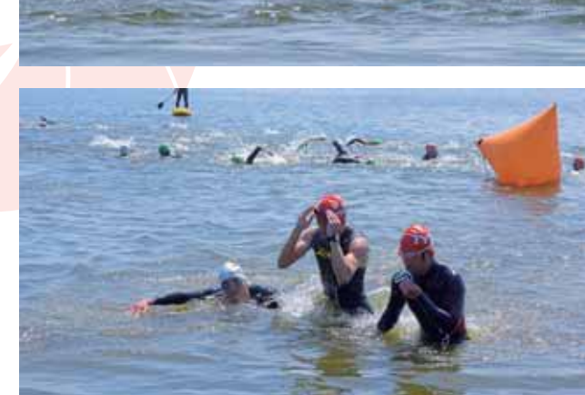
↑泳ぎ終わると、1秒を惜しむようにロードバイク乗り場へ