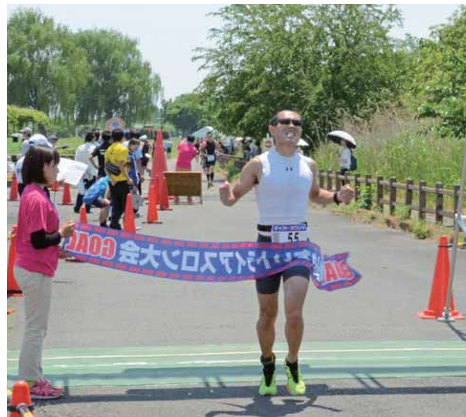
↓スイム、バイク、ランのすべてを終えて感動のゴールを迎えました