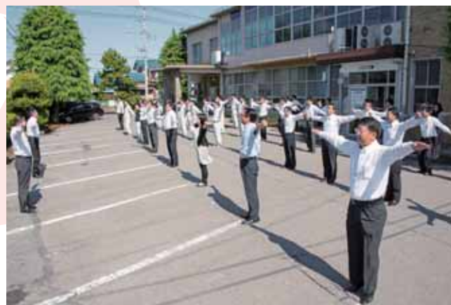
↑ラジオ体操をする本庁舎勤務の町職員たち

2月1日(日)、中央公民館で町制施行60周年記念式典が開催されました。このなかで町は、健康づくりを推進し、健康寿命の延伸を図るために、町民・地域・行政が一体となって課題に取り組む「健康づくりのまち」宣言を行いました。この「健康づくりのまち」宣言に伴い、町職員は始業時間前に毎日ラジオ体操をしています。また、町立保育園の園児たちも登園後に毎日ラジオ体操をしています。