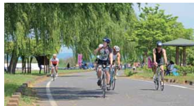
↓泳ぎ終わったら次に40kmロードバイクで走ります

5月17日(日)、第24回遊水地ふれあいトライアスロン大会兼第25回群馬県選手権大会が開催され529人が参加しました。競技は、五輪と同じ方式のスイム1.5km、バイク40km、ラン10kmの「スタンダード」、「リレー」、距離を半分にした「スプリント」、「ビギナー」で行われました。今回の「スタンダード」総合男子優勝者の記録は2時間2分2秒でした。