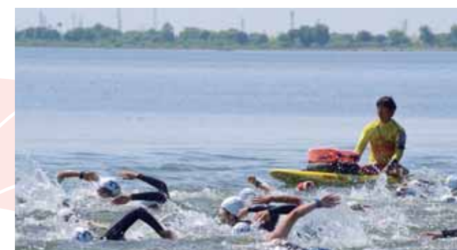
↓選手たちはスタートしてはじめて1.5km泳ぎます