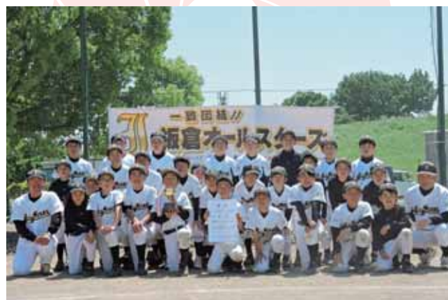
↑トーナメント戦を勝ち抜き見事優勝した板倉オールスターズ

5月10日(日)に、渡良瀬グラウンドで板倉町スポーツ少年団交流野球大会が開催されました。この大会には板倉オールスターズ(板倉町)、千代田少年野球クラブ(千代田町)、長柄ドジャース(邑楽町)、三小メッツ(館林市)の4チームが参加しました。トーナメント戦の決勝戦は板倉オールスターズと長柄ドジャースが対戦。板倉オールスターズが6-5の逆転サヨナラ勝ちで見事優勝しました。