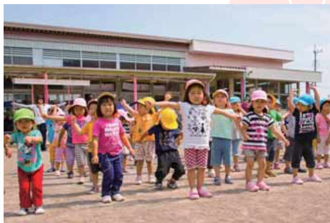
↑ラジオ体操をする板倉保育園の園児たち