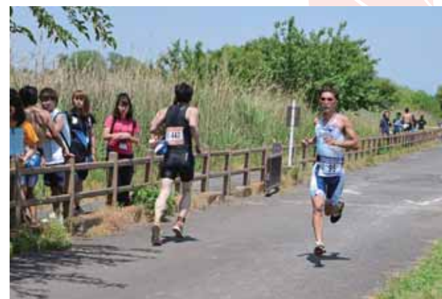
↑ロードバイクの次は、最後の力を振り絞って10km走ります