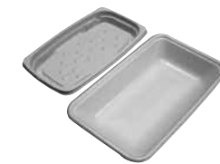
剃身などのパック

食品トレイやレトルトパック等、容器包装プラスチック類はこれまで「燃えるごみ」として出せましたが、4月からはこれらを「容器包装プラスチック」として資源分別することになりました。