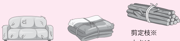
ソファ 布団 剪定枝※ 太さ10cm、長さ2m以内