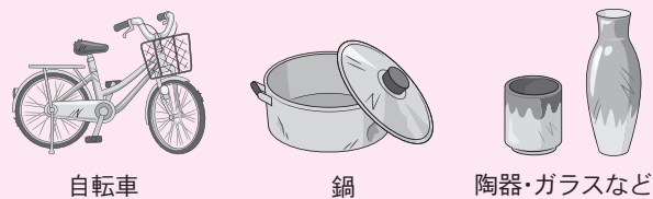
自転車 鍋 陶器・ガラスなど