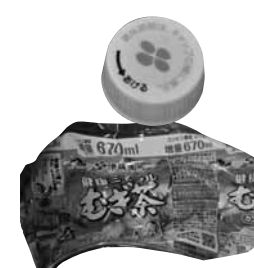
ペットボトルの キャップとラベル