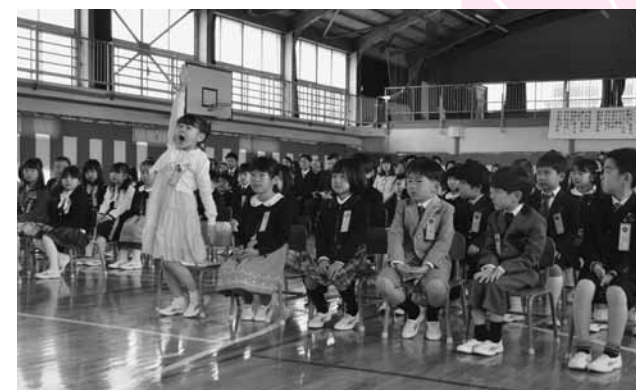
成長を感じる元気いっぱいの返事