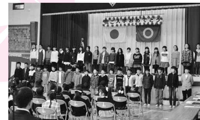
上級生達が校歌斉唱で新入学生を歓迎