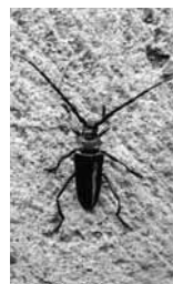
首が赤く、成虫は約2.5〜4cm