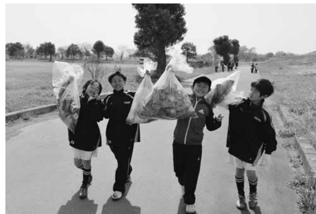
ごみ拾い、がんばったぞ！