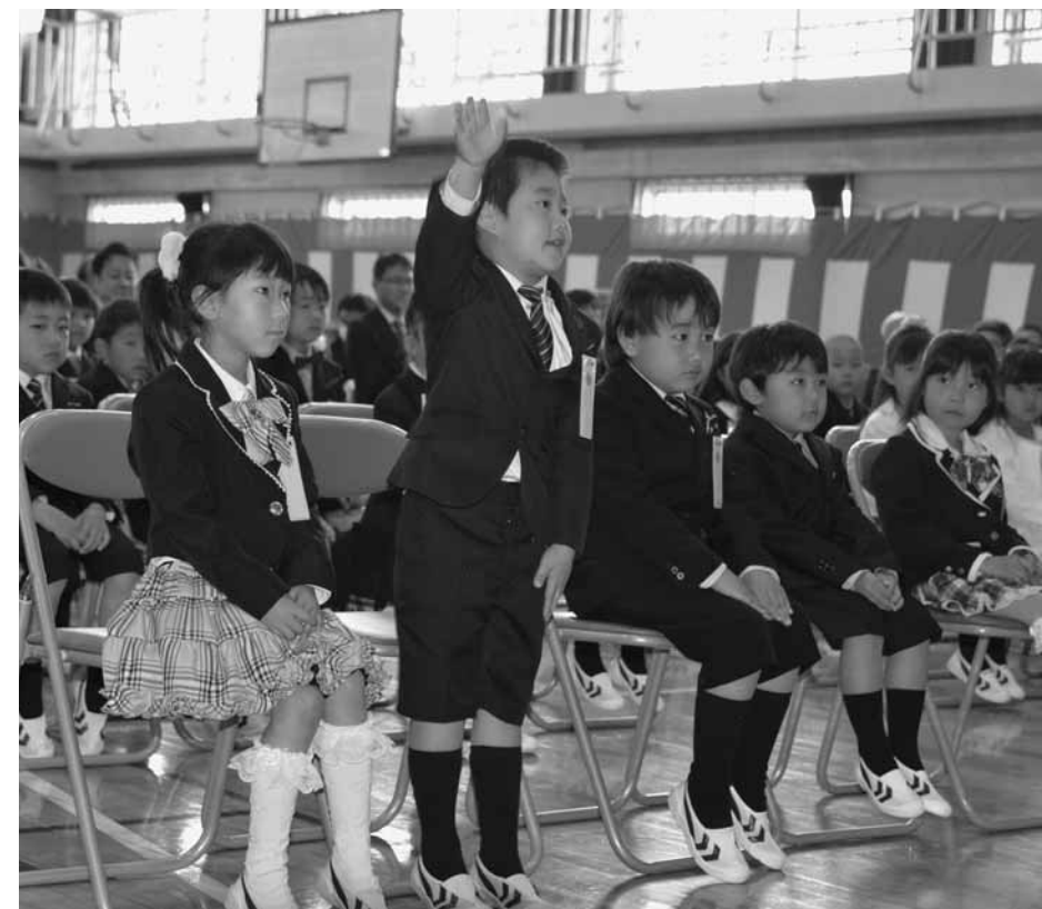
担任の先生から名前を呼ばれて元気よく立ち上がる新一年生