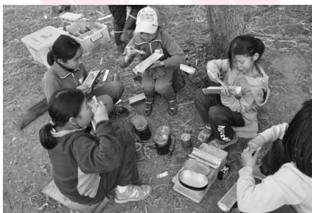
竹で作った食器で食べるごはんは格別

サバイバルキャンプにはプログラムやスケジュールはなく、大人が手を貸さない、携帯電話などの電子機器は持ち込まないという決まり以外はルールも特にありません。参加した子どもたちは苦勞をしながらも、テントの設営、食器づくり、火おこし、料理などを協力して行いました。