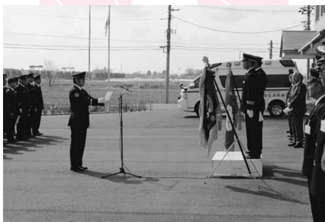
団員を代表して宣誓する根岸第2分団長