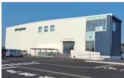
操業開始したパルシステムの板倉食品加工センター

平成23年9月に産業用地進出第1号となる㈱ミルックスを皮切りに、現在まで製造業や倉庫業、卸売業など多種多様な企業13社が、産業用地全体面積の48.9%に進出しています。