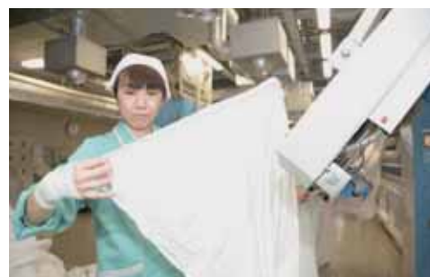
400人を超える人達が働いています

4・5ページでは、板倉ニュータウン産業用地内に進出した各企業の紹介にあわせて、企業からのメッセージ情報などもご紹介します。