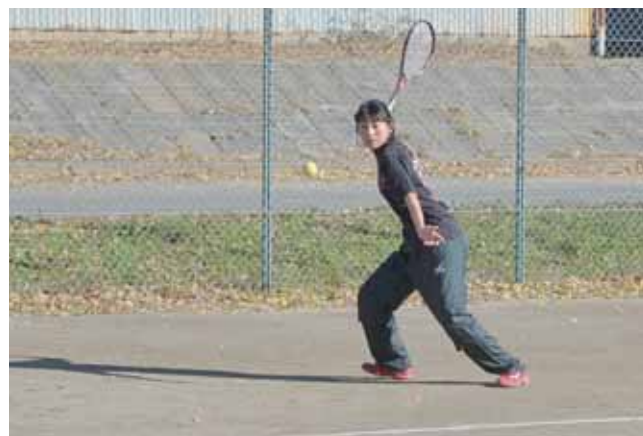
鋭い打球がコートを行き交う