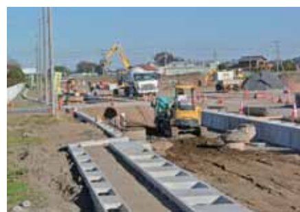
産業団地の分譲開始に向けて造成中

現在、誘致交渉中の区画を除くと、分譲可能な区画は、比較的小規模な区画が2区画のみとなっています。しかし、一方ではさらに大きな区画を板倉ニュータウンの産業用地内に求める企業からの問い合わせもあります。