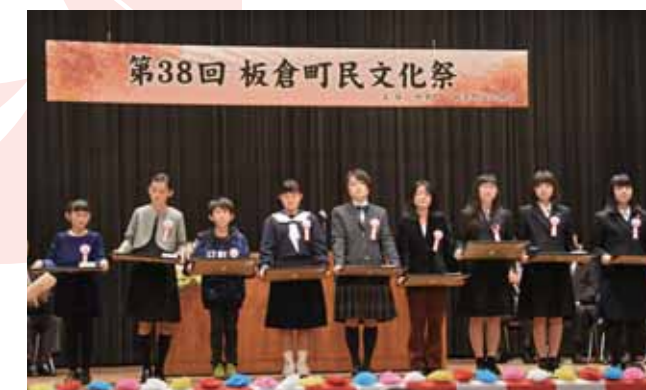
式典での表彰式の様子