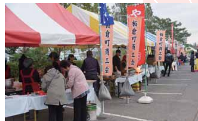
公民館の外で行われた商工祭