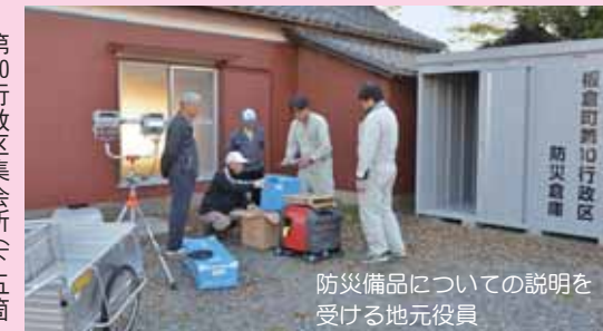
防災備品についての説明を受ける地元役員

第10行政区集会所(下五箇・金蔵院)に防災倉庫および防災備品が整備されました。これらの倉庫や備品は宝くじの社会貢献普及広報やコミュニティの健全な発展を図ることを目的に、財団法人自治総合センターが行っている「コミュニティ助成事業」を活用して整備を受けたものです。全国で発売される宝くじの収益金の一部は、こうした地域の健全な発展のために使われています。 問合せ 行政安全係 ☎内線 121