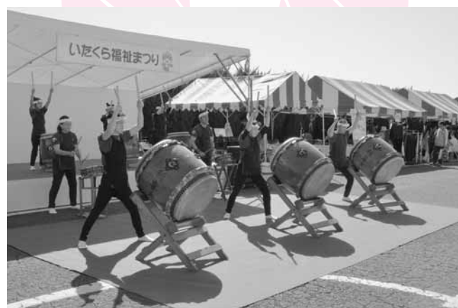
迫力の演奏をする稲妻太鼓愛好会

10月21日(日)、板倉町総合老人福祉センターで第23回いたくら福祉まつりが開催されました。今年の福祉まつりは晴天に恵まれ、会場は多くの人出でにぎわいました。ステージでの発表のほか、さまざまな福祉に関連するテントや模擬店が並び、福祉センターの中でも、足湯あり、移動児童館でカプラを楽しむ子ども達の姿があるなど、福祉に触れながら楽しむ一日となりました。