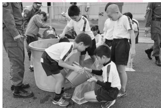
簡易水防工法を体験する東小学校の4年生

10月中に、合の川水防センターで町内各小学校の4年生を対象に水防学校が開かれました。利根川上流河川事務所のかたから板倉町の洪水の歴史や3K(気づく、考える、行動する)を学び、自分や家族の避難行動計画「マイ・タイムライン」を作った後に、降雨体験車による豪雨体験や、ビニール袋に水を入れプランターとビニールシートを利用した簡易水防工法などを行いました。