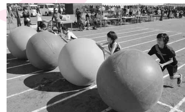
スポーツ少年団対抗混合リレー