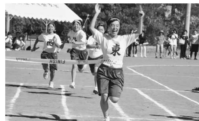
中学生地区対抗リレー