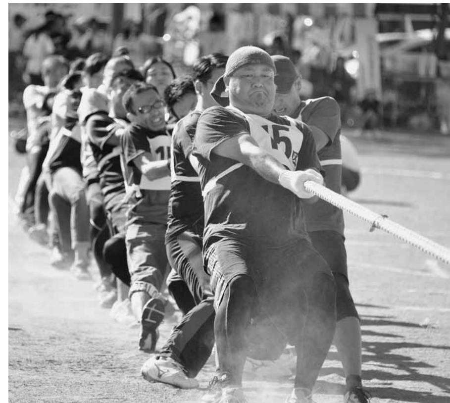
力のこもる綱引き