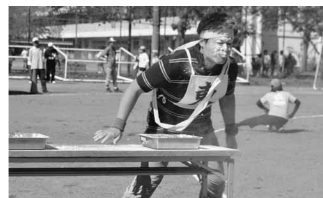
あらかし運動会(子ども会育成会)