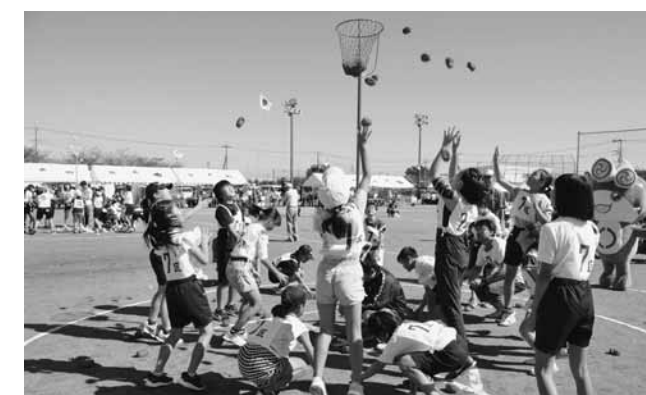
行政区対抗玉入れ