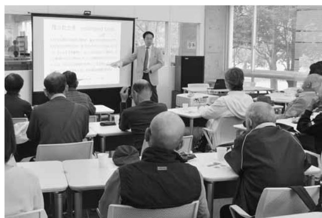
オープンな雰囲気で行われた特別公開講座

10月14日(日)、北部公民館で「北部公民館まつり」が行われました。講堂では、日頃の練習の成果発表があり、1階ロビーや2階会議室では山野草や陶芸、絵手紙、編み物などさまざまな作品展示が行われました。また、駐車場ではいろいろな模擬店が出店されたり、東洋大学大道芸サークルによるパフォーマンスが行われるなど、公民館まつりを盛り上げていました。