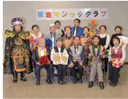
中央公民館 板倉マジッククラブ発表会

期日 2月17日（日） 時間 午後1時開場 午後1時30分開演 会場 中央公民館大ホール 入場料 無料 主催 板倉マジッククラブ