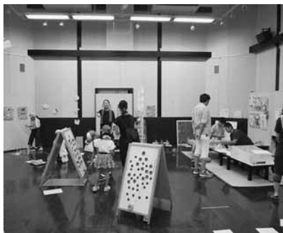
わたらせ自然館 図画工作ワークス2019展

東部公民館 悠々講座 食育講座 日時 8月30日(金)午前10時30分 内容 乳幼児向けの食育栄養講座 対象 成人20名(子どもと一緒に参加できます) 受付期間 8月7日(木)～21日(水)