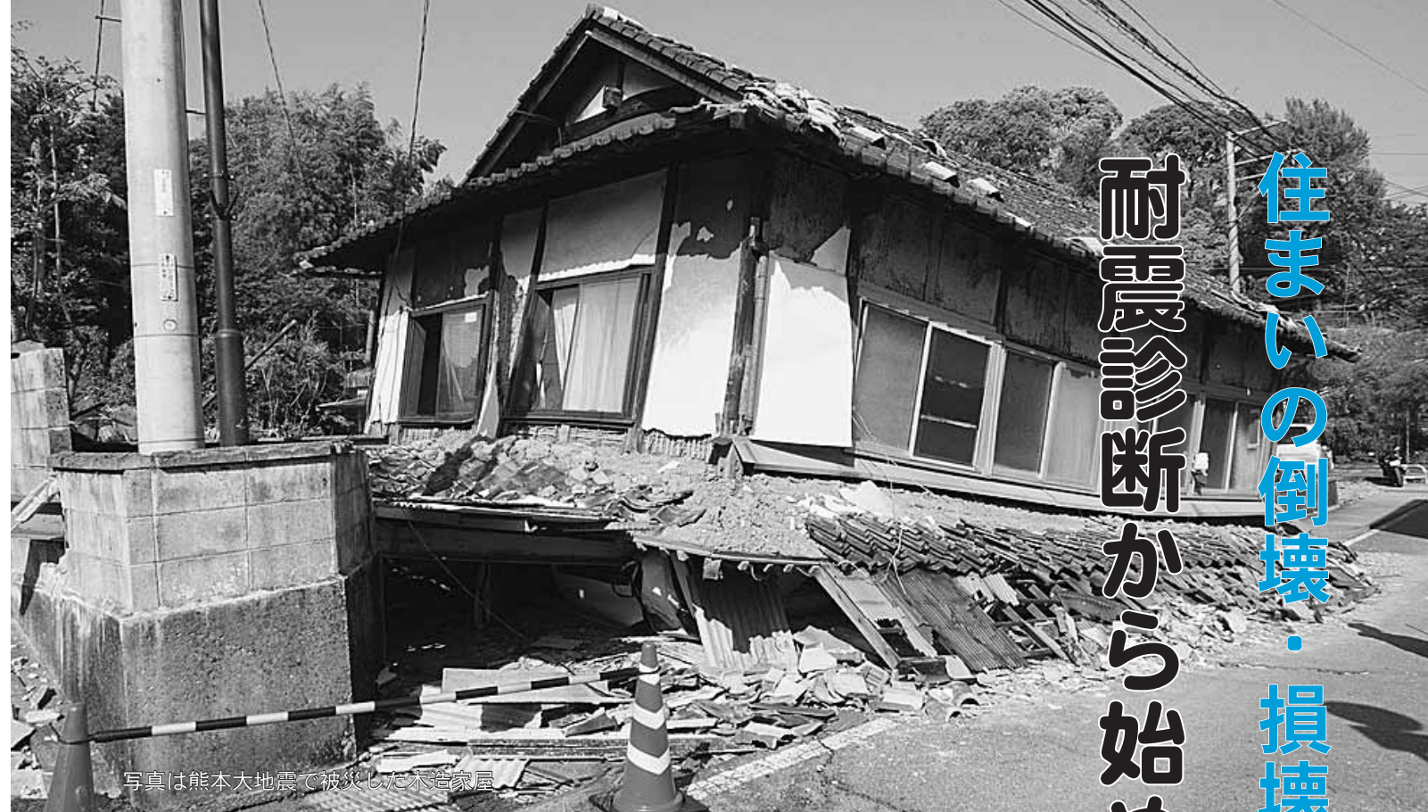
写真は熊本大地震で被災した木造家屋