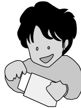
通知は3月中旬以降に 発送される予定です

接種券と本人確認証(運転免許証、健康保険証など)を必ずお持ちください。接種後、2回目の予約をします。(1回目の接種から3週間の間隔をあけて接種)