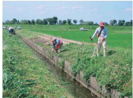
写真 2-5-2 水路の藻刈り作業