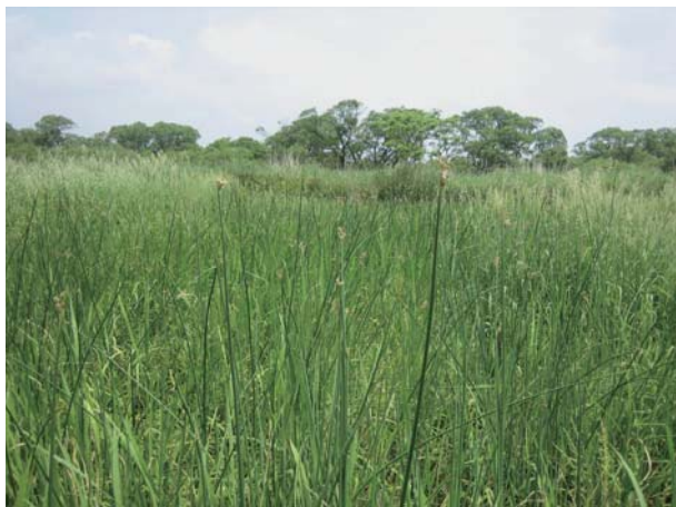
谷田川に群生するオオイグサ

このように万葉集が詠まれた時代よりこの地は低湿地であったことが推察できる。さらに板倉中学校や南小学校の校歌にも謳われており、本地域における象徴的な植物である。