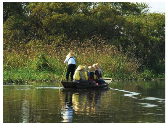
写真 2-5-4 揚舟ツアー（谷田川）