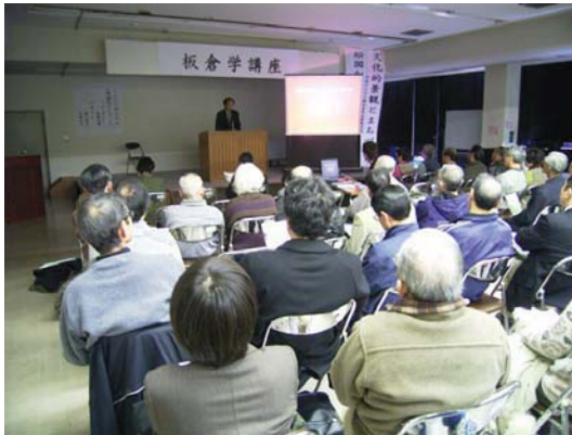
写真 2-5-1 毎年実施されている板倉学講座