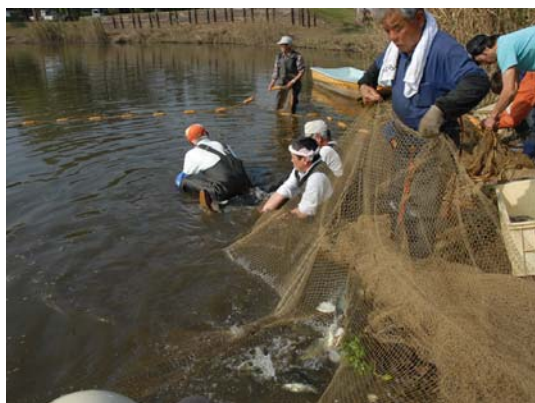
写真 2-6-3 柄池での地引網