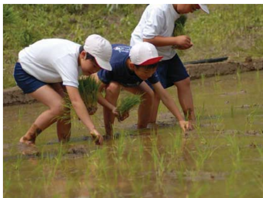
写真 2-6-1 川田での体験学習

さらには水塚所有者等の協力のもと、「(仮称)『水塚』所有者の会」を発足し、各地域にある自主防災組織などと連携を図り、更なる行政組織とのネットワーク化を図ることで、万が一の洪水被害に備えた地域防災の体制づくりの強化に繋げていくことを将来目標とする。