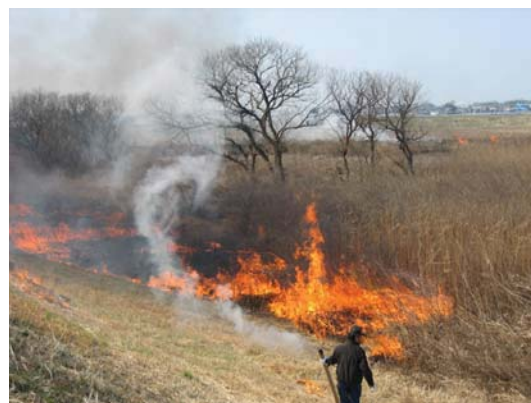
写真 2-6-2 シバ焼き風景 (谷田川)