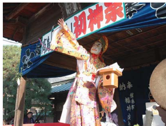
写真 2-6-4 郷土芸能