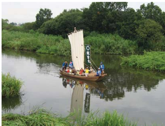
写真 2-5-3 復元された高瀬船の操船