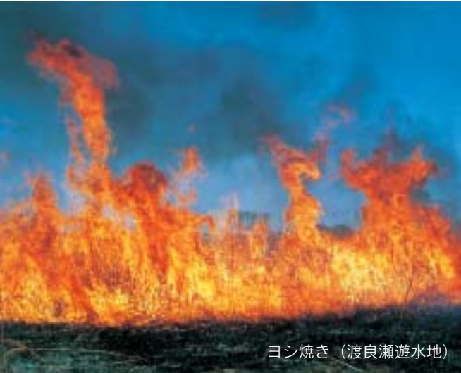
ヨシ焼き（渡良瀬遊水地）

この「板倉らしい風景」は、先人と現代に生きる私たちをつなぐ架け橋であり、その風景の中に、きっと未来の「板倉らしさ」を考えていく手がかりがあるはずです。