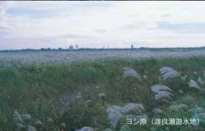
ヨシ原（渡良瀬遊水地）