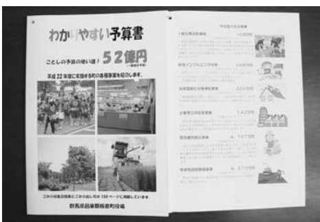
▲「わかりやすい予算書」で町政を知る