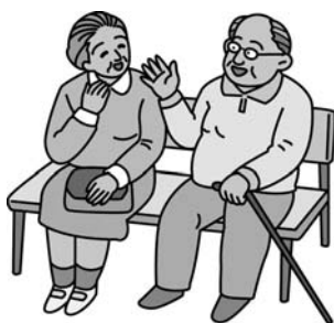
▲高齢者が安心の社会を築くためにはどうする

間の高齢化に伴い医療費増加は進む宿命にある。結果的に国内の大部分の自治体国保会計は、赤字となっている。国でも国保審議会の議論が続いていると聞く。広域一元化運営案も検討中と聞き期待をしている。板倉町は突出した法定外繰出金で国保を維持している。税制においても都市型は資産割の賦課は低く、板倉町は農村型で資産割が高い状況にある。高齢者が資産を抱えて、年金を国保税に充てる状況と見える。結果的に滞納増加になっているようだ。平成25年に国の審議会の答申が出るのを待つ。