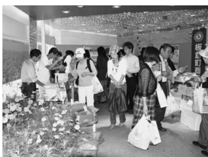
▲東京銀座の群馬ちゃん家で町の PR 活動が盛ん

答・町長 町を代表する企業もたくさんあることから出展に理解をいただきながら、町の PR の場として施設を最大限に活用していきたい。昨年の反省点から色々な意見等を伺いながら早い段階から計画を進め実践に移したい。