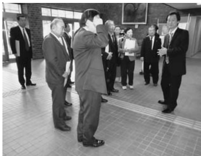
▲前橋地方裁判所法廷見学にて

平成23年を迎え少なくとも明るい光が見えて来るよう、農工商、それぞれの皆さんが努力をした結果、対価の得られる板倉町にしたいと思っております。