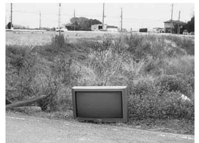
▲廃家電等の不法投棄を無くしきれ ない町を

問・町民の交通事故防止の一 つとして、カーブミラー の破損修理を素早くする ため、ミラーの破損など に気づいた町民から情報 提供してもらうため、役 場担当課の連絡先を記し た「通報先表示シール」 をカーブミラーの支柱に 張りつけ、町民の事故防 止策を講じては。