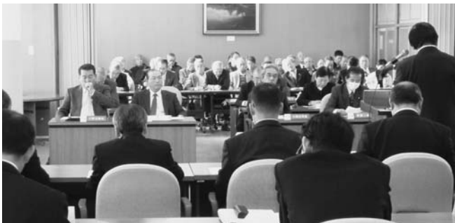
▲白熱した12月臨時議会の様子

高さをうかがわせていました。なお、臨時会の会議録については、町のホームページに掲載しますので、ぜひご覧になって下さい。