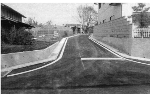
▲きめ細かな臨時交付金でインフラ整備が進む