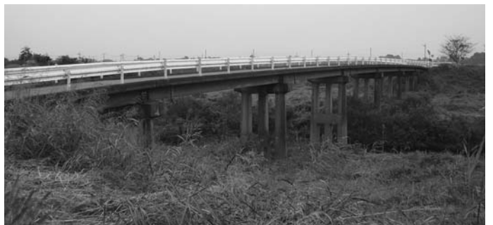
▲八間樋橋架け替えの実現が待たれる

者との話し合いもあり、整備に向けしっかりやっていきたい。」というコメント。群馬県の川瀬県土整備部長においては、「県土整備プランに明記されているので、平成29年度までに完成する約束は守っていきたい。」ということであった。そこで現在の進捗状況について伺いたい。 答・企画財政課長 群馬県側は平成22年2月に都市計画決定が完了している。埼玉県側については、測量調査等が進んでいる。平成21年2月には、路線が決定し、南地区、東地区、北川辺地区でも地元説明会を開催している。 答・町長 2017年から2019年頃までに行けると理解し、認識している。