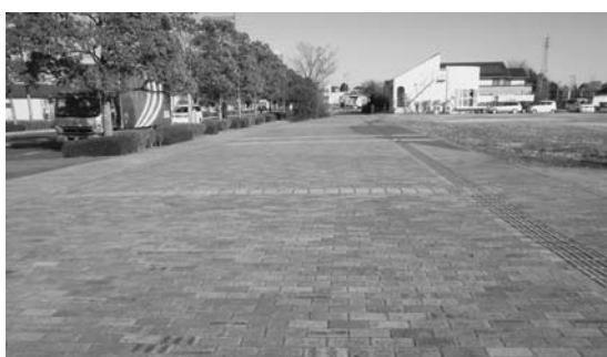
▲空き地が目立つ板倉ニュータウン駅前商業地

答・町長 貧しいとか貧しく ないという議論には、一 つは比較財政論、もう一 つは本質的な財政論と2 種類あると思う。大泉、 明和、邑楽、千代田町に 比べた比較財政論で、板 倉町の財政は厳しいと 言っているのである。群 馬県全体の町村部におい ては、板倉財政もやや中 位の位置にあるという認 識である。