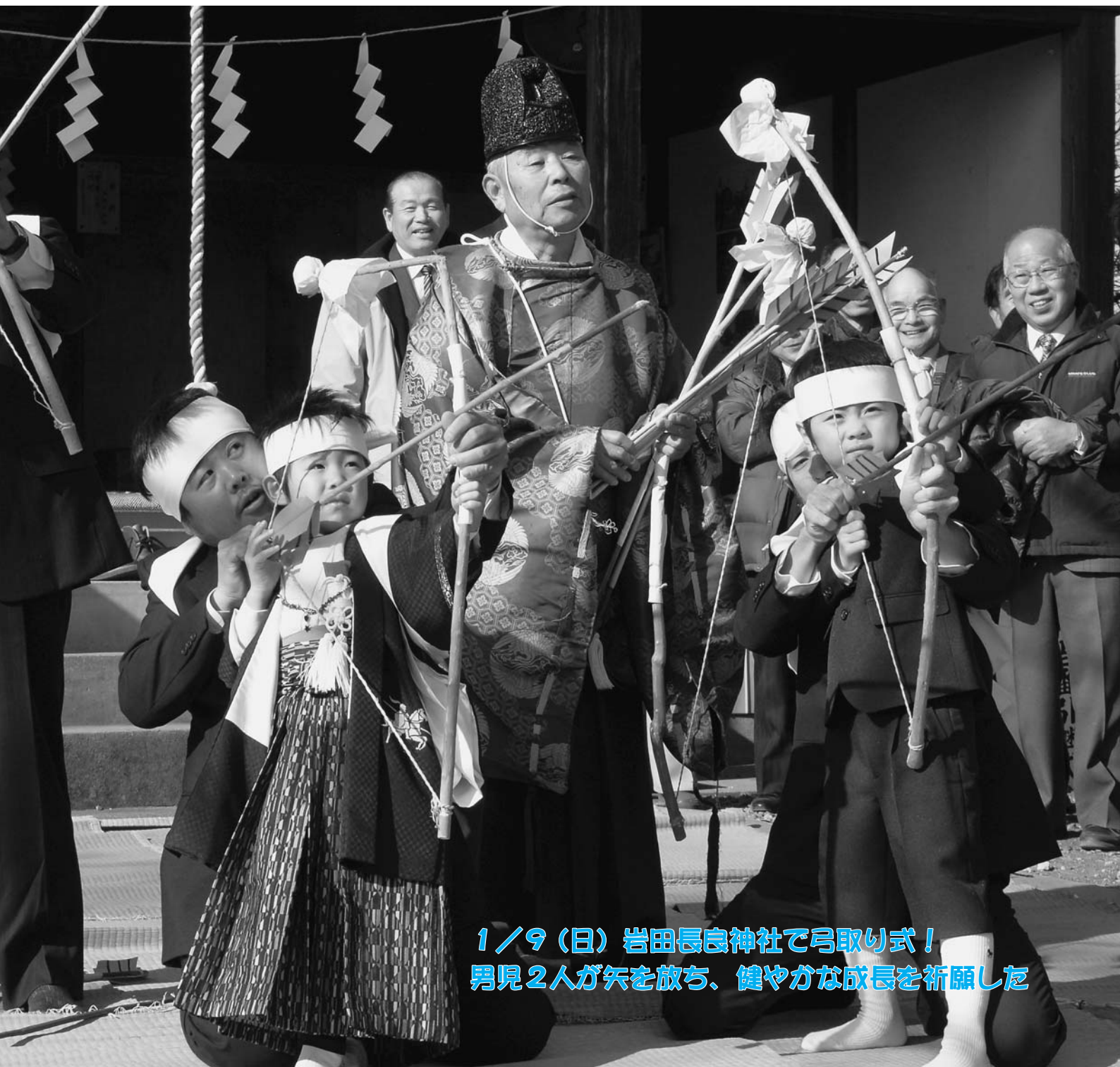
1 / 9 (日) 岩田長良神社で弓取り式！ 男児2人が矢を放ち、健やかな成長を祈願した