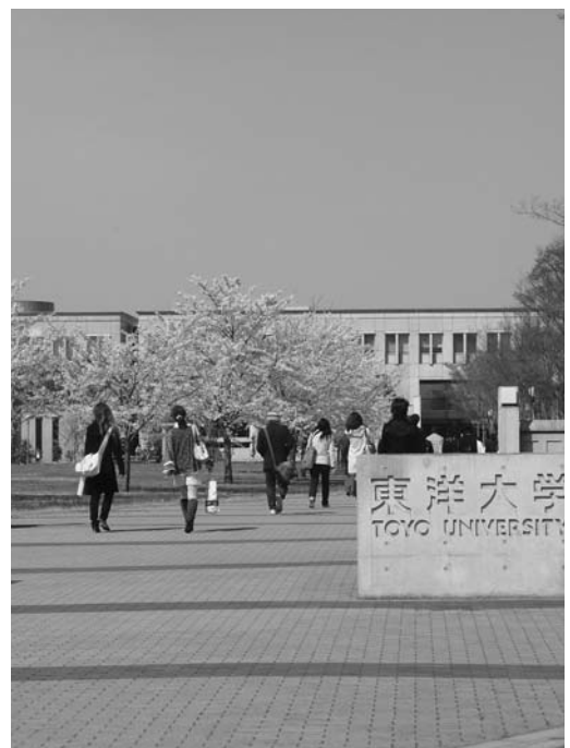
▲東洋大学女子駅伝部の創設はどうなるの

答・町長 自由に使えるお金が非常に限られているが、その中でも張りつけた予算編成をしているが、今後ともできるだけ、神経をつかいながら特色をつけて、必要なものからやるという姿勢でいきたい。