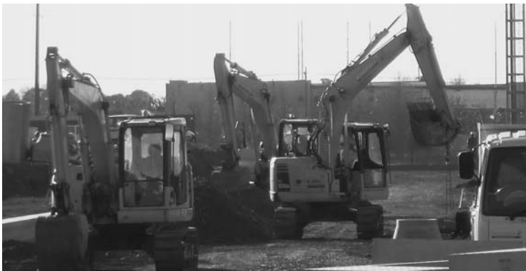
▲企業誘致に向けて産業団地造成工事が急ピッチ

答・産業振興課長 6月から本格的に誘致活動に取り組んでいる。現在、物流業2社、リース業1社と交渉を継続中である。また、先月東京都内の企業の方が、2社ほど来て説明を行ったところである。