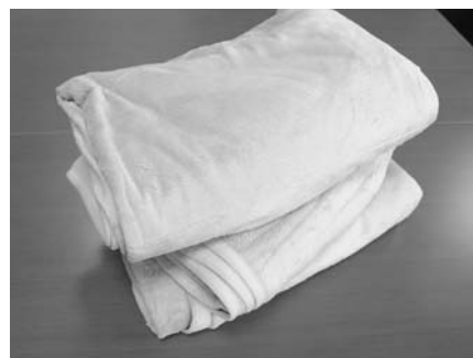
▲クリーニングを行う使用済み毛布

◆避難所に配置する職員に対する説明が不十分であり、各避難所ごとの対応に違いがありました。飲料水に関しては、水道が利用できる状況では配布すべきではなかったと考