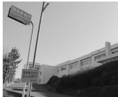
▲避難所となる東小学校

答・総務課長 ペットは家族の一員、大切な命であることは理解しているが、まずは人命を最優先とさせていただいた。北地区