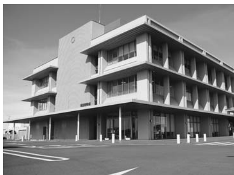
(5) 議会だより No.152 令和2年2月1日

問・副町長は、地方自治法、合併特例法に基づいて設置されている法定合併協議会の議決について法的効力がないと各所で度々発言している。しかし、