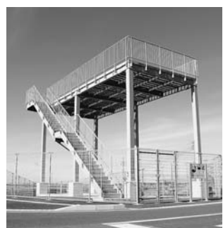
▲洪水避難タワーの様子

問・建設費2,600万円で建設した洪水避難タワーを、緊急避難指示が出ている有事の際に、なぜ鍵がかかり使用できない状況だったのか。 答・総務課長 今回は洪水避難タワーは使用しなかった。洪水避難タワーは避難が遅れた方が命からがら避難する施設である。今回は屋内の避難所へ誘導を優先させ、万が一越水したときは、町職員が洪水避難タワーに向かい鍵をあける予定であった。