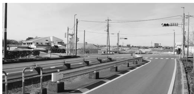
▲国道 354 号バイパスと旧道との交差点(板倉ゴルフ場入口)

問・国道354号に設置してある右折レーンへ誤って進入する車が年に何件か見受けられる。ゴルフ場入口交差点を改良してもらえないか。 答・総務課長 管轄する館林警察署と館林土木事務所へ説明を行い、12月6日に町同伴で現地確認を行った。中央分離帯の視認性確保のため、ガードレールの一部撤去、右折の誘導線、路肩へのポストコーンなどを今年度内に設置する予定とした。 問・国も検討をはじめ、近隣