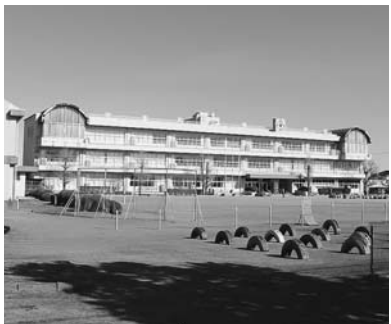
▲476人が避難した南小学校

からの移動の真相と今後の対策は。 答・総務課長 南小の避難の関係については、災害対策本部から避難所への配置職員への正確な情報伝達できていなかったことが原因であることが判明した。利根川上流河川事務所長から町長に午前4時ごろ北川辺地内で越水する可能性が高いとの通報があり、町災害対策本部で対応、南小2階の避難者を3階及び屋上へ移っていた。また、南小は避難者で満杯になるため、自宅にとどまっている住民は、西小、北小、板中に避難するよう、本部で決定し、早速南小へ伝達並びに防災ラジオ等で緊急避難指示を出した。南小学校への伝達内