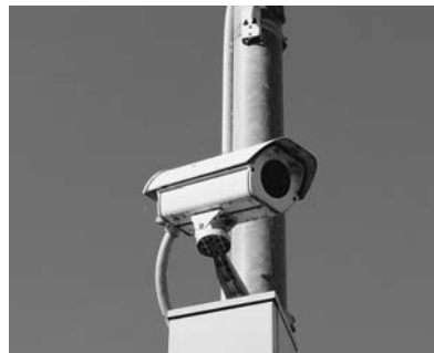
▲町内に設置されている防犯カメラ

ことだが、今年度は予算の計上もされていない設置の予定はないようだが、今後防犯カメラの数は増やしていくべきだと思うが今後の計画は。