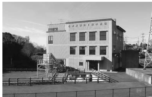
▲109 時間稼働し続けた邑楽東部第1 排水機場

問・避難の発令は、板倉町避難勧告等の判断伝達マニュアルにそって、「空振りを恐れずに早めに出す」を実践できたのか。 答・総務課長 災害対策本部にて、進路予想、気象情報、予想雨量、利根川の水位到達予測など協議し、明るいうちに避難してもらったため、早めの避難を発令した。 問・避難場所での受付の仕方は問題がなかったか。 答・総務課長 家族単位で避難者カードへの記入を求