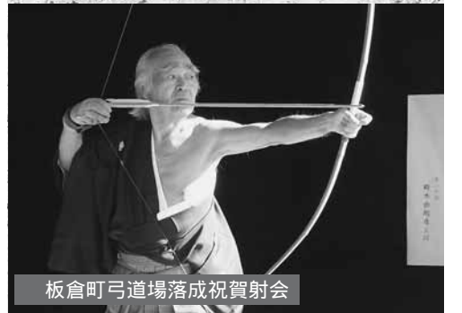
板倉町弓道場落成祝賀射会