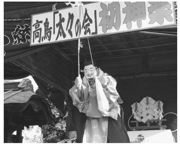
高鳥天満宮の祭事のときに、 神楽殿で演じられる太々神楽

年ころまで演じられてきました。が、後継者不足のため途絶えていました。平成13年、再度、岡里の神楽講中（館林市重要無形民俗文化財「大島岡里神代神楽」）の指導のもとに、地元有志11名によって高鳥天満宮の