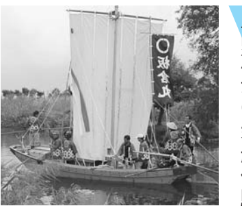
約40分かけて、谷田川 周遊コースを巡ります