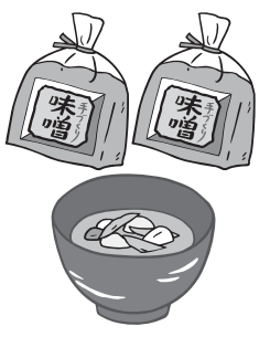
手づくりみそで おいしいみそ汁

ご家族のために無添加のみそを作ってみませんか。簡単に作れますので、ぜひチャレンジしてください。 受付開始 8月5日(日) 1組4人以上のグループでお申し込みください。 問合せ・申込先 南部公民館 ☎82-1424