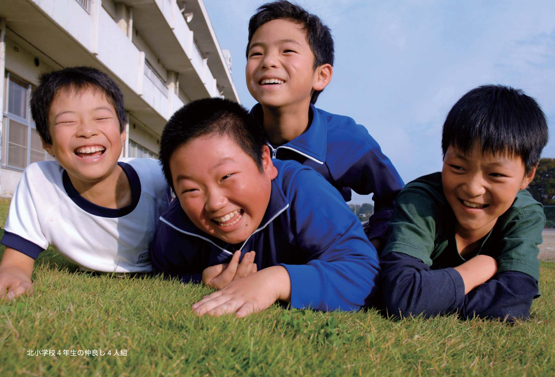
北小学校4年生の仲よし4人組

板倉町で生まれ、板倉町で成長していく子どもたちは、この町にあるあたたかい絆の中で心あたたかい大人へと成長し、そして後にこの町へ新たな絆をたくさん作ってくれるでしょう。