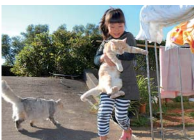
妹の雛ちゃんに猫たちも とってもなついてます