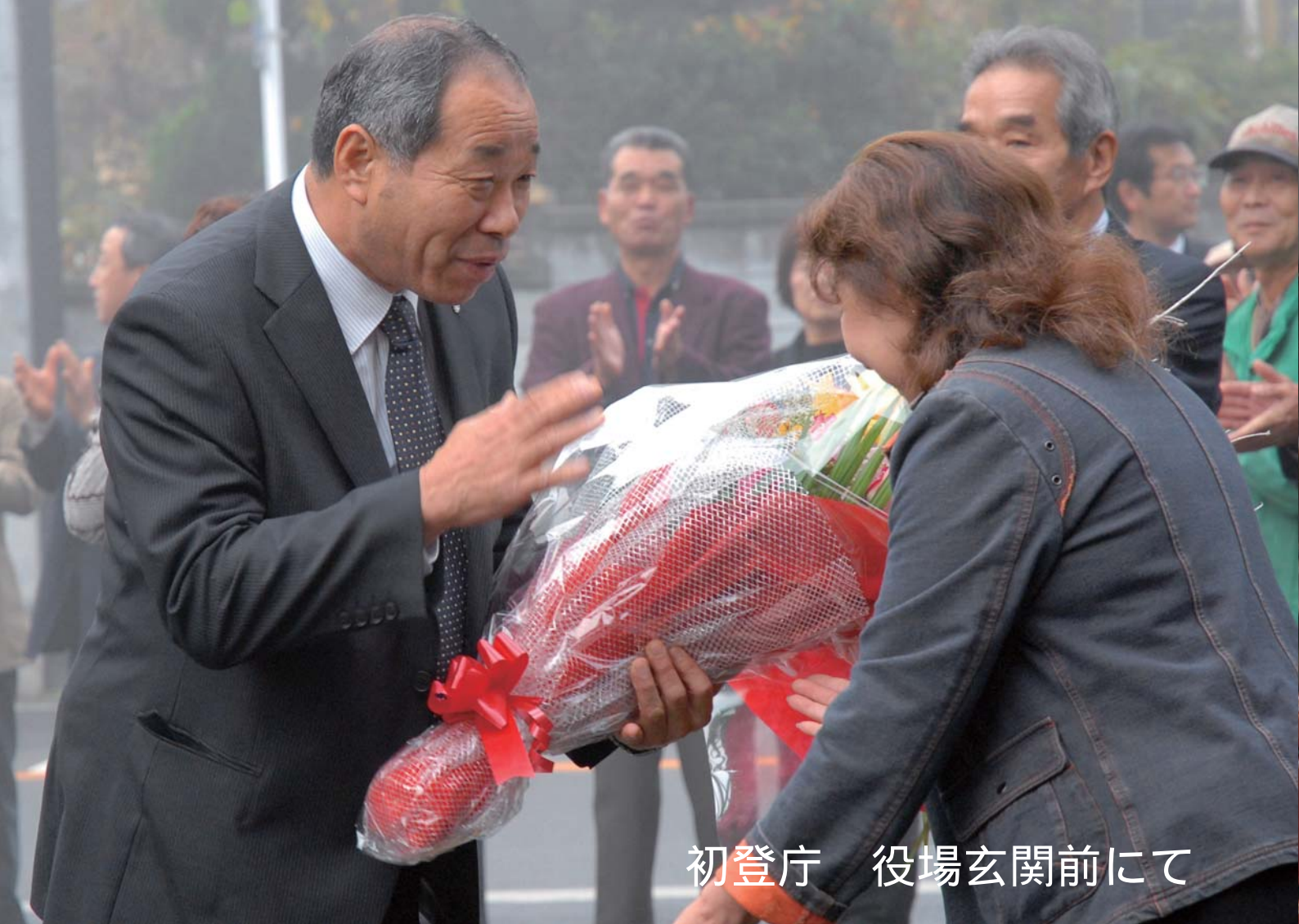
初登庁 役場玄関前にて