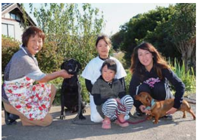
動物が大好きな岡島家 家族みんなで世話をします