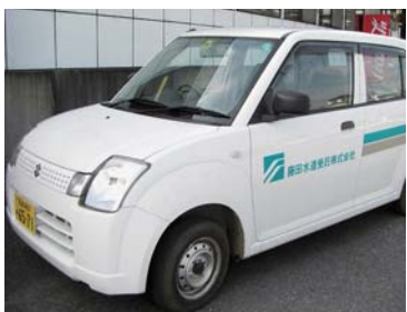
こちらの車で巡回します ご協力をお願いします