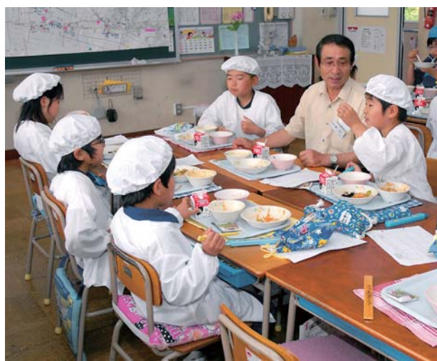
おいしい給食をいただきながら、親ほくを深めます