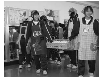
中学校給食室を改修します

町民、企業、行政が一体となった町づくりが必要です。この計画に基づき、町づくりの課題や方向性を皆様と共有しながら施策を推進します。なお、詳細は町公式ホームページをご覧ください。 http://www.town.itakura.gunma.jp/