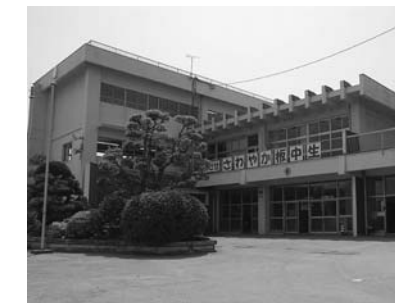
中学校の防火区画を改修します

町では板倉町第4次総合計画の実現に向けて財政改革プランを策定し、プランを基に3年間区切りの事業計画及び財政計画を策定しています。 主要事業計画概要 平成20年度から22年度にかけて実施する主要事業計画は次のとおりです。 多様化する高齢者のニーズに対応するため、民間活力の参入を図り、施設整備の補助をします。 多様化する保育のニーズに対応するため、特別保育事業を民間保育所において実施します。