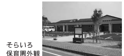
そらいろ保育園外観