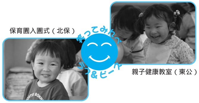
保育園入園式(北保)

「サバイバル」とは「生き残りをかけた戦い」。地球温暖化による異常気象が多発する現代、いつ何が起ころかわかりません。ライフラインのキャンピングが役立つことと、思い立ちます。 恒例のGW、毎年恒例の渡良瀬遊水地で、キャンピング用品や調理品は使用せず、サバイバルなパーベキューに挑戦し、すべて材料から手作りにこだわります。 心新緑のGW、毎年恒例の渡良瀬遊水地で、キャンピング用品や調理品は使用せず、サバイバルなパーベキューに挑戦し、すべて材料から手作りにこだわります。