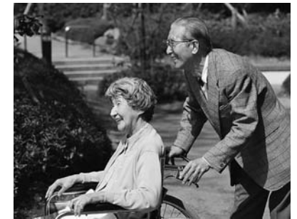
高齢者ニーズへの対応

保育の実施が必要な児童などを民間保育所に委託し、質の高い保育を提供します。子育て環境の整備を図るため、少子化対策としての次世代育成支援対策推進法に基づき、行動計画を策定します。保護者の就労環境の整備を図るため、放課後児童の安全を確保し、学童保育事業運営の補助をします。