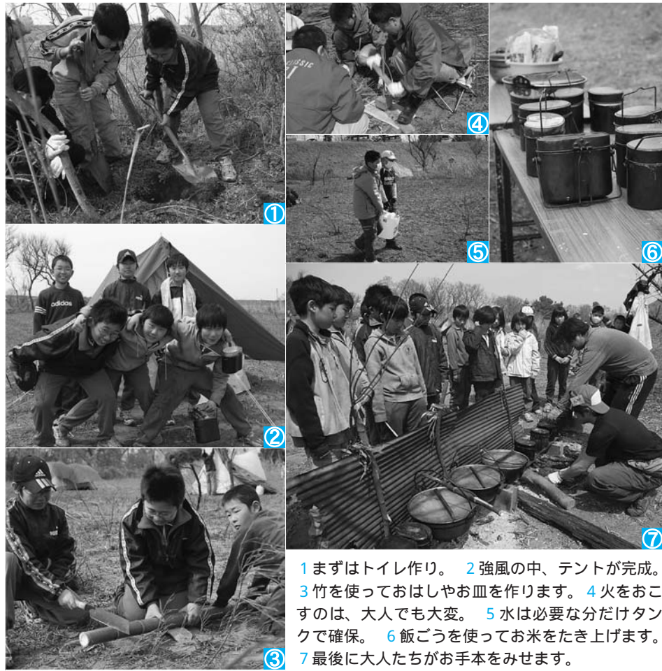
1 まずはトイレ作り。 2 強風の中、テントが完成。 3 竹を使っておはしやお皿を作ります。 4 火をおこすのは、大人でも大変。 5 水は必要な分だけタンクで確保。 6 飯ごうを使ってお米をたき上げます。 7 最後に大人たちがお手本をみせます。