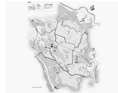
ハザードマップの見直し