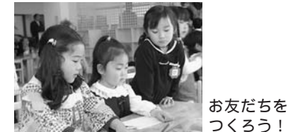
お友だちをつくろう!

子育てサロン(製作・身体測定など) 毎週火曜日・木曜日・金曜日 午前10時～正午 電話相談 毎週水曜日 園庭開放 毎週土曜日 電話相談以外については会員登録が必要です。会員登録の状況で事業の日程などが変更になる可能性もあります。 問合せ そらいろ保育園 ☎82-8811