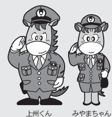
上州くん みやまちゃん 群馬県警察マスコットキャラクター

受講料 8,500円 (テキスト、例題集代含む) 試験 6月22日(日) 午前9時 会場 太田市関東学園大学など 受験料 甲種 5,000円 乙種 3,400円 丙種 2,700円 受付期間 5月7日(水)～16日(金) 申込先・問合せ 板倉分署 ☎82・1138