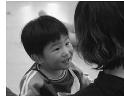
特別保育事業を実施