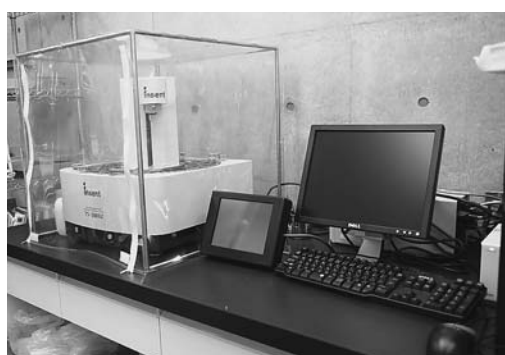
味認識装置 味を科学的に評価