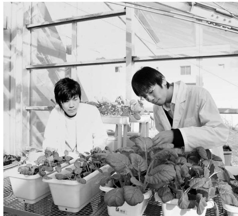
植物機能研究センターのガラス室では研究用の植物の栽培が行われています。