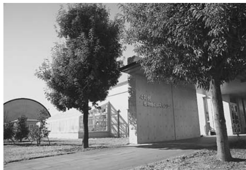
植物機能研究センターの外観

そうです。今年も開催する予定とのことですので、皆さんぜひ参加してみてください。今後は、広報紙などでもお知らせしていきたいと思えます。 また、取材の中で下村教授は、「大学と農家のかたがいつしょになって、気軽に農業について語りあえる場を『学農喫茶』として設けてみてはいかがでしょう？」と提案してくださいました。大学側からの働きかけではなかなか集まりにくいのが現状です。役場や農家のかたが積極的に働きかけて、『学農喫茶』を立ち上げてみてはいかがでしょうか。地場産の野菜をつまみながら、栽培技術の話や困ったことなどを相談し、親ほくを深め、やがては新品種の野菜作りの話などもおもしろそうですね。 東洋大学生命科学部は4月から新たに、応用生物科学科と環境科学科が増えます。優秀な研究者と最先端の設備が町内にありながら、利用しないのはもったいないと思います。未来の板倉農業のために、植物機能研究センターとの協働を考えてみませんか。