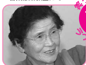
音楽療法教室にて

♪箱根駅伝にて総合優勝を果たした東洋大学。選手たちは日々の練習の成果を発揮し、見事な走りを見せてくれました。風邪をこじらせ、マスクがはずせないT。年頭の誓いはどこへやら。 ♪子どもたちと車で音楽を楽しんでいま。最近のお気に入りは「がんばれ日本、すごいぞ日本」のフレーズを熱唱。不景気と言われる今ですが、この曲を聞くと不思議と元気がわいてきます。(H)