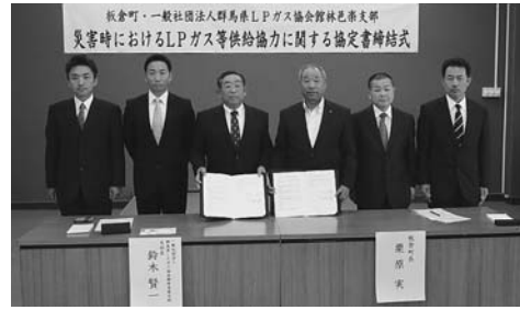
↑(一社)群馬県LPGガス協会 館林・邑楽支部と協定を締結しました

5月12日(月)に、(一社)群馬県LPGガス協会館林・邑楽支部と災害時におけるLPGガス等供給協力に関する協定を締結しました。この協定は、災