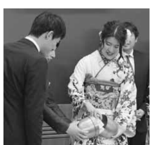
▲タイムカプセル開封式

町では、新成人のかた がたを対象に、20歳の門 出を祝して「令和元年度板 倉町成人式」を開催しま す。また、立志式の際、将 来の夢などをはがきに書 いて入れた、タイムカプ セルの開封式も実施しま す。新成人だけでなく一 般のかたも来場できます