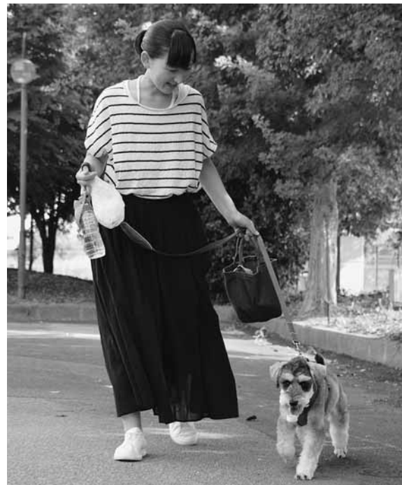
散歩のマナーを守り、おしっこをしたときは水をかけ、フンをしたときはビニール袋などに入れて必ず持ち帰りましょう