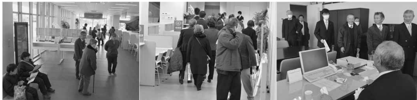
明るい1階の窓口フロア 2階も多くのかたが見学 町長室も公開されました