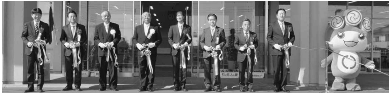
式典会場から新庁舎正面入口に移ってのテープカット