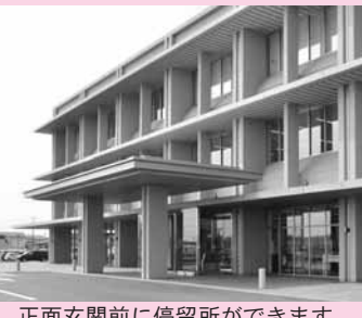
正面玄関前に停留所ができます

4月1日新設 新庁舎前にバス停留所 役場新庁舎前のバス停留所新設に伴い、4月1日から路線バスの経路を変更します。