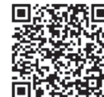
国税庁LINE 公式アカウント

農業用免税軽油の 申請手続き集中受付期間 軽油に課される軽油引取税（32・1円/1ℓ）は、農業に使用する場合は、あらかじめ