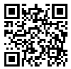
女性のがん検診 申込みフォーム