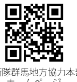
自衛隊群馬地方協力本部ホームページ

募集種目 ▼航空学生(海上・航空) 応募資格 18歳以上24歳未満 受付期限 8月28日(金) ▼一般曹候補生 応募資格 18歳以上33歳未満 受付期限 9月1日(火) ▼2等陸・海・空士(任期制自衛官) 応募資格 18歳以上33歳未満 受付期限 随時 問合せ 自衛隊群馬地方協力本部太田出張所 ☎33-7305