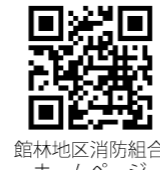
館林地区消防組合ホームページ

※その他、採用試験に関する詳細はホームページに掲載しています。 問合せ 館林地区消防組合消防本部総務課庶務係 ☎72-7229