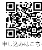
申し込みはこちら