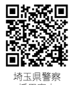
埼玉県警察採用案内

【埼玉県警察】 受付期間 7月6日(月)～8月14日(金) 第一次試験 9月6日(日) 問合せ 埼玉県警察採用センター ☎0120-373514