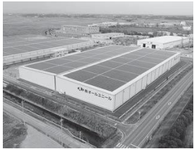
板倉ニュータウン産業用地

答：産業振興課長 結論からいうと現在、計画はない。長期間にわたり低迷しているニュータウンの分譲については、県の企業局による令和