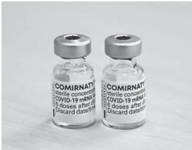
新型コロナウイルスワクチン（使用済容器）

健康介護課長 4月26日の週には、全国の市町村に1箱ずつは配送となっている。65歳以上の方をすべてに打