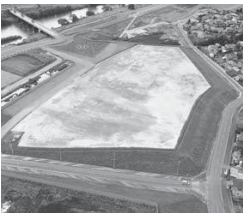
避難場所整備イメージ(茨城県五霞町)