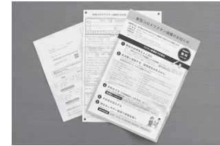
65歳以上対象コロナワクチン接種のお知らせ

◆専決処分事項の承認について(令和2年度板倉町一般会計補正予算(第8号)) 令和3年2月9日付けで専決処分を行った一般会計補正予算で、歳入歳出