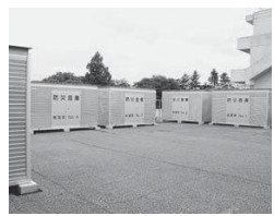
旧北小敷地に設置された防疫倉庫