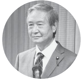
本間 清 議員