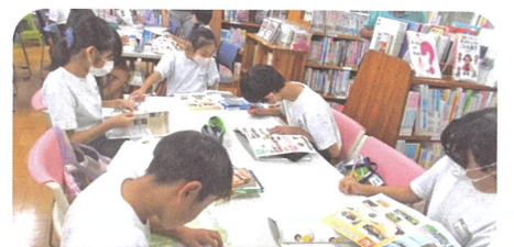
6年生:パンフレット等の情報を読み取り