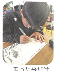
走った分だけ カードに色塗り