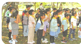
2年生:茨城県自然博物館