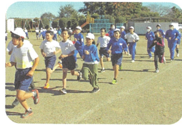
会話できる速さで全校ランニングタイム