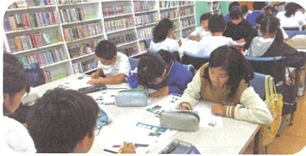
4年生:伝統工芸品の魅力を調べる

国語に限らず、いろいろな教科と連携して調べ学習をしたり、調べてまとめたことを発表したりする時間を図書室で行っています。読み聞かせによる意欲付けや、ふあみ読(家庭で読書に親しむファミリー読書)、よむよむ日記(読んだ本の記録を付ける読書日記)などの記録を積み重ねることを通して、日々読書に親しんでいます。