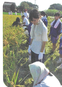
米づくりを知る 良いきっかけに

職業に関する理解を深め、望ましい職業観形成の素地を養ったり、様々な職種の職業の実体験をするため、職業体験学習を実施しています。職業体験学習では、働くことへの意義や身につけるべき能力や態度についての理解を深め、達成感や充実感を得ています。