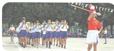
5・6年生鼓笛パレード