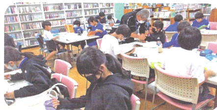
5年生:統計資料の読み方を学習