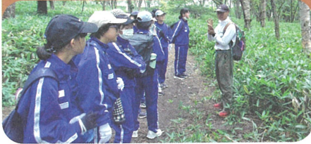
自然の空気に癒されながら