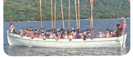
みんなの気持ちがひとつに