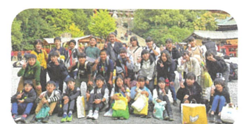
6年生:鶴ヶ岡八幡宮