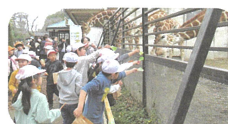
1年生:宇都宮動物園