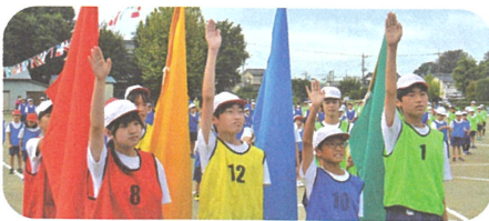
団長による選手宣誓

10月14日に運動会が開催されました。晴天にも恵まれ、児童たちは、「一番星じゃなくていい!4色で作る一つの思い出」のスローガンのもと、徒競走や遊競技、ダンス、鼓笛パレード、団対抗リレーなどに真剣に取り組み、参観された来賓の方々や保護者、地域の皆様から盛大な拍手をいただきました。スローガンでは、「一番星じゃなくていい」とありましたが、児童一人一人の笑顔が一番星のように輝いていました。