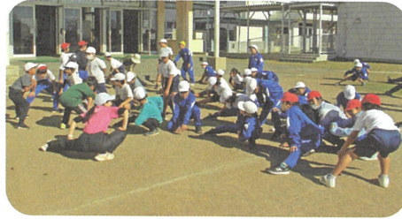
学年ごとに準備運動

シャトルラン大会に向けて、毎日のブーストチャレンジ(ランニングタイム)では、体力の向上を目的に無理のない速さで走っています。自己目標達成に向けて頑張っています。