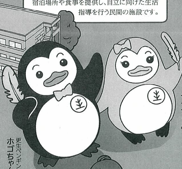
更生ペンギンの ホコちゃん

刑務所等を出た後、帰る場所がない人たちに宿泊場所や食事を提供し、自立に向けた生活指導を行う民間の施設です。