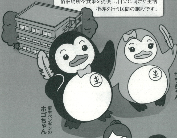
更生ペンギンの ホゴちゃん

刑務所等を出た後、帰る場所がない人たちに宿泊場所や食事を提供し、自立に向けた生活指導を行う民間の施設です。